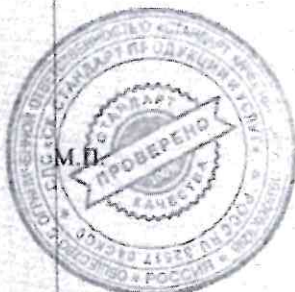
Схема сертификации 1